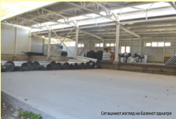
Сегашниот изглед на базенот однатре

градбата, односно на 4 септември 2021 година. Следуваат пролонгирања на рокот до 31 мај 2022 година, а потоа и до 7 февруари 2024 година, кои се направени без склучување анекс на договорот. Во моментов на сила е четвртиот рок, направен со склучување на анекс на договорот и според којшто сите работи околу изградбата на базенот треба да завршат до 30 декември 2024 година. Но, наместо забрзување на градбата, следува нов прекин; во август 2024 година, изградбата е стопирана затоа што во меѓувреме истекол договорот со фирмата за надзор над проектот „ЗИМ-Заводот за испитување на материјали и развој на нови технологии Скопје“. Воедно, од Министерството за спорт, како наследник на Агенцијата за спорт и млади, најавуваат дека ќе се спроведува ревизија на реализираните проекти и на проектите кои се во тек.