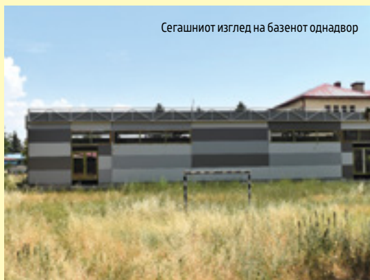
Сегашниот изглед на базенот однадвор

Во согласност со договорот склучен на 7 февруари 2020 година, изградбата на базенот требало да чини 705 илјади евра. Но, на 29 јуни 2023 година, склучен е анекс-договор за зголемување на цената за изградба на базенот за 16 %, односно за повеќе од 110 илјади евра. Во согласност со овие измени, фирмата „Енергоинвест Трејд Глигор и др. ДОО“ Скопје за изградбата на базенот ќе добие вкупно 815 илјади евра. Како причина за зголемување на цената за изградбата на базенот се наведени непредвидени околности, односно зголемување на цените на материјалите и на суровините на пазарот. Покрај зголемувањето на вредноста на договорот, дополнително е проблематично и тоа што според обезбедениот извештај од надзорот на изградбата на базенот, заклучно со мај 2024 година, се реализирани само 45 % од предвидените градежни работи за базенот. Но, од друга страна, на фирмата изведувач, заклучно со август, ѝ се платени 74 % вкупната вредност на договорот. Поконкретно, според податоците од Министерството за спорт, за градење на базенот во Битола, на „Енергоинвест Трејд Глигор и др. ДОО“ Скопје ѝ се платени околу 604 илјади евра. Двете измени на договорите се скриени од јавноста, односно не е почитувана законската обврска за нивно објавување на Електронскиот систем за јавни набавки. Така, двата анекси на договорот за изградба на базенот се добиени преку барање за пристап до информации од јавен карактер.