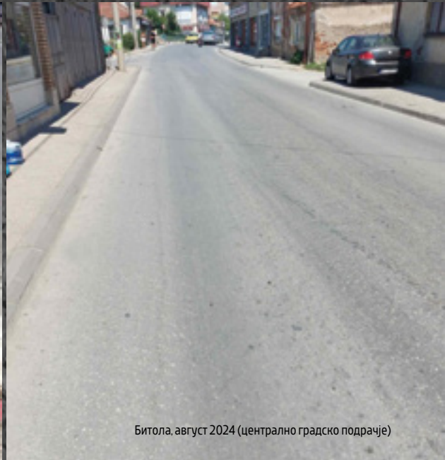
Битола, август 2024 (централно градско подрачје)