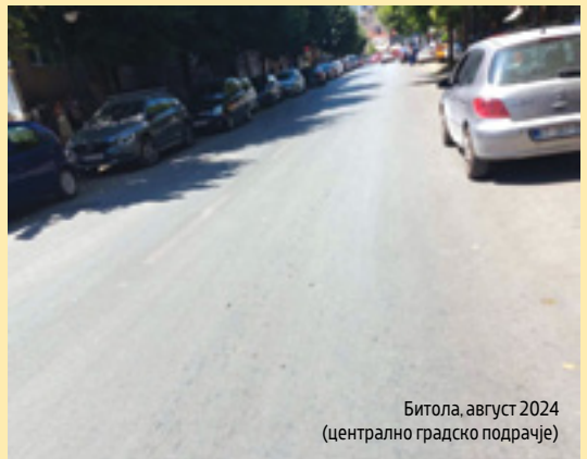
Битола, август 2024 (централно градско подрачје)

Во документите што ЈП Паркинзи ги објавило на Електронскиот систем за јавни набавки недостигаат информации за видот и потеклото на набавената машина за бележење и на бојата за бележење. Оттука, не може јасно да се посочи во кој дел од синцирот – од набавката на бои и машина, сè до извршување на работите за бележење и нивната исплата – се јавува недостатокот. Со оглед на тоа што јавното претпријатие нема своја веб-страница, не може да се направи ниту увид во годишните извештаи, за да се воочи дали е докрај испочитувана обврската – првото бележење на хоризонталната сигнализација да е направено на цела територија на градот, на што укажува фактот што е потрошена и платена целата количина на боја. Доколку е тоа направено, се отвора прашањето зошто тогаш улиците се необележани. Дали е проблемот во неквалитетно бележење? Ако е така, тогаш причините може да бидат: неквалитетна машина за бележење, некомпатибилна боја со претходно набавената машина, неквалитетна боја доколку само на хартија се побарани стандардите за квалитет на бојата, непочитување на стандардите според кои се