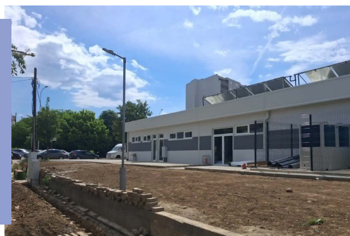
Базенот на 21 мај 2026 година